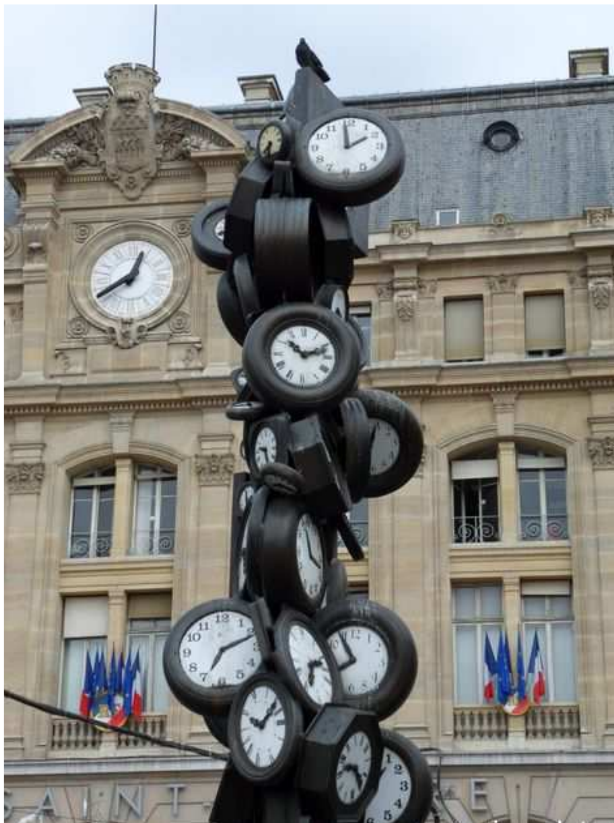
L'Heure de Tous, Gare Saint Lazare, Paris