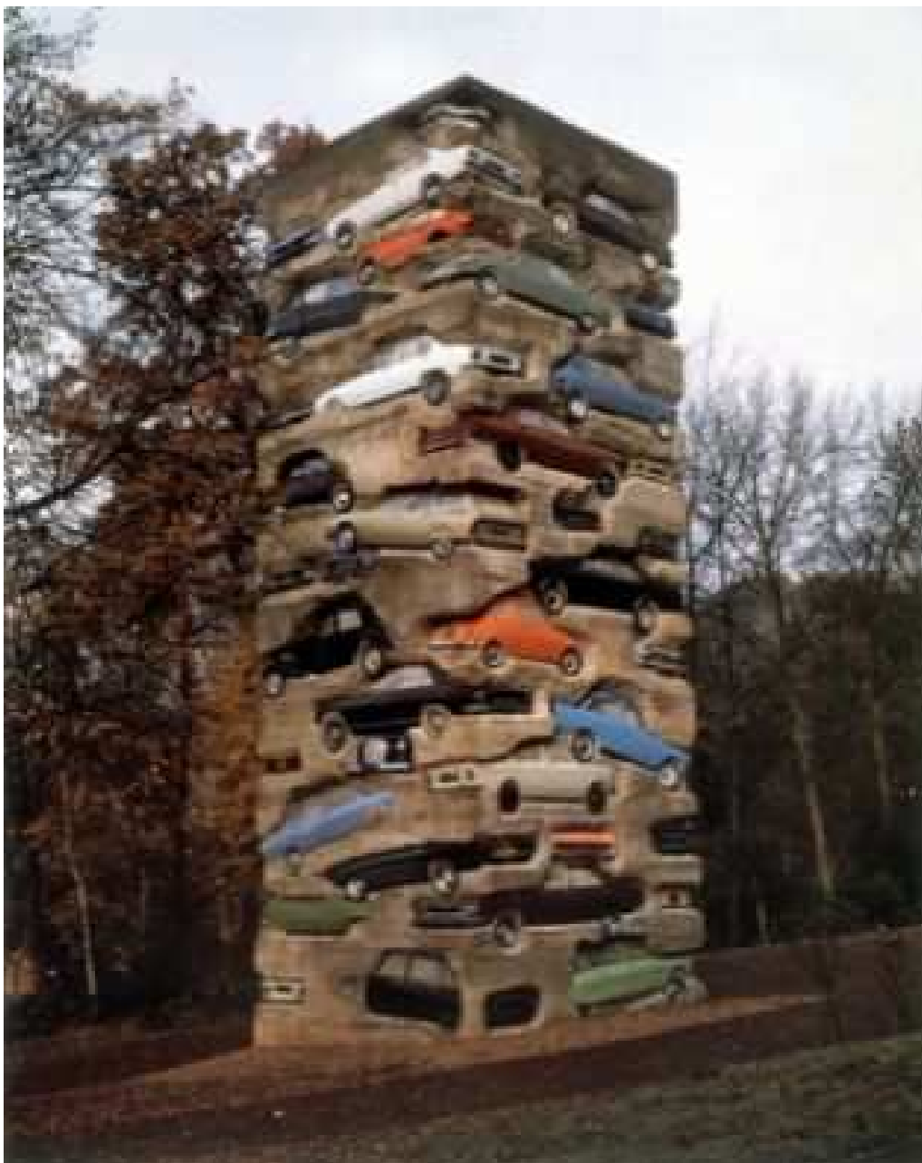
The Long Term Parking , Domaine Montcel, Jouy-en-Josas