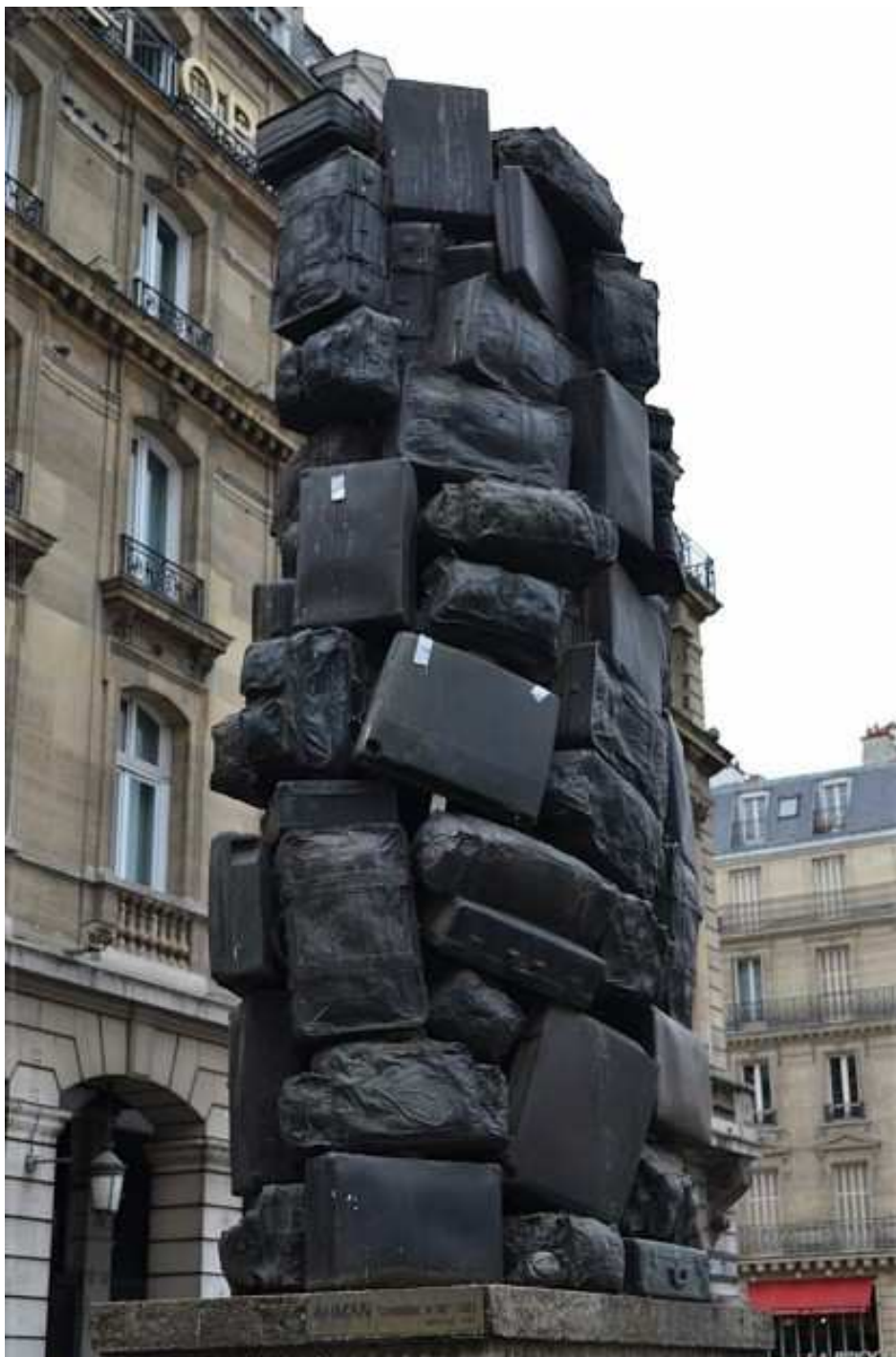
Consigne à vie , Gare Saint-Lazare, Paris