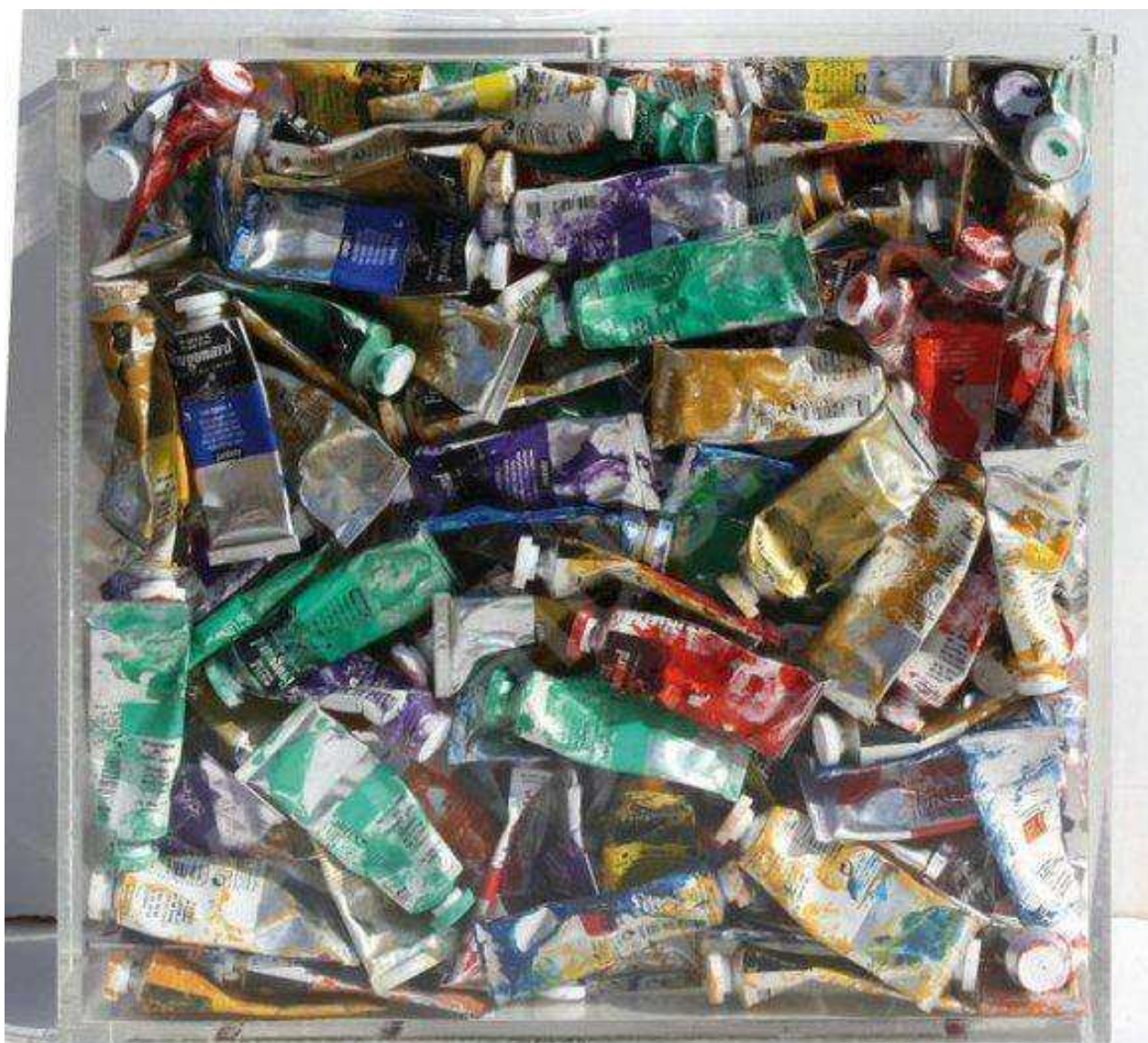
Poubelles de tubes