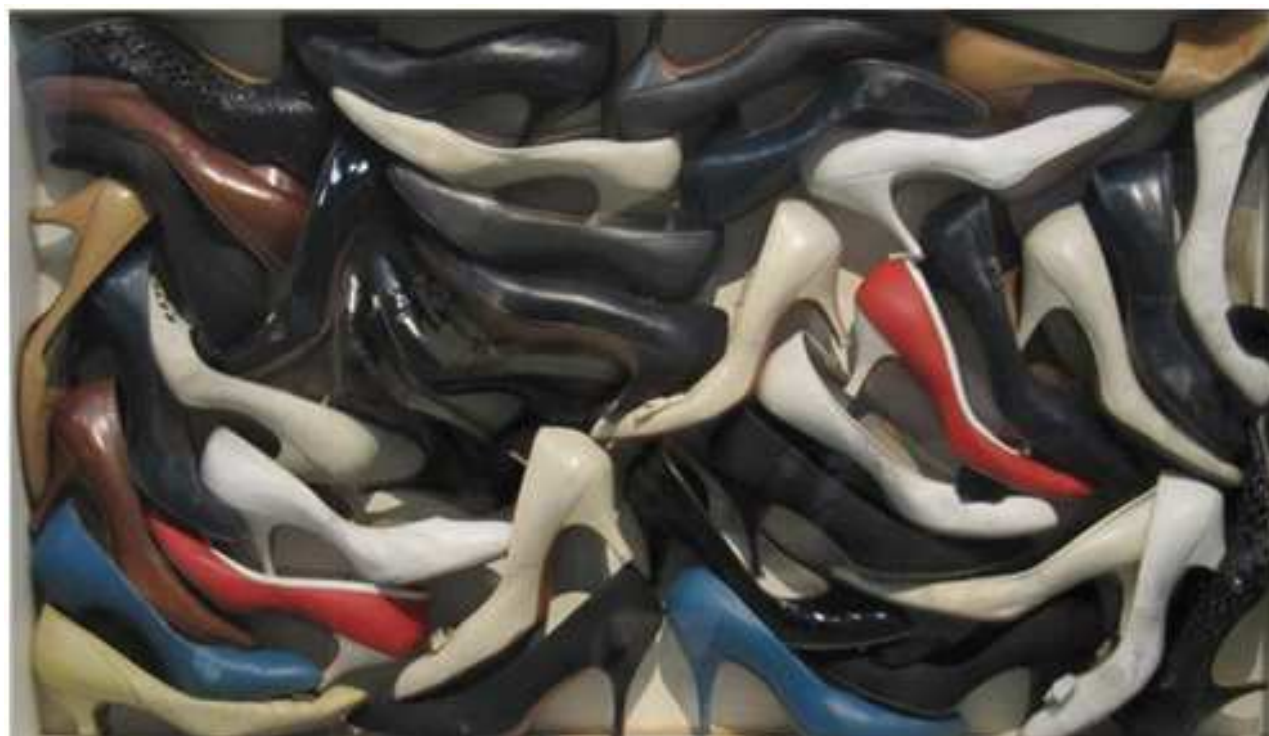
Accumulation d'escarpins dans boîte en bois