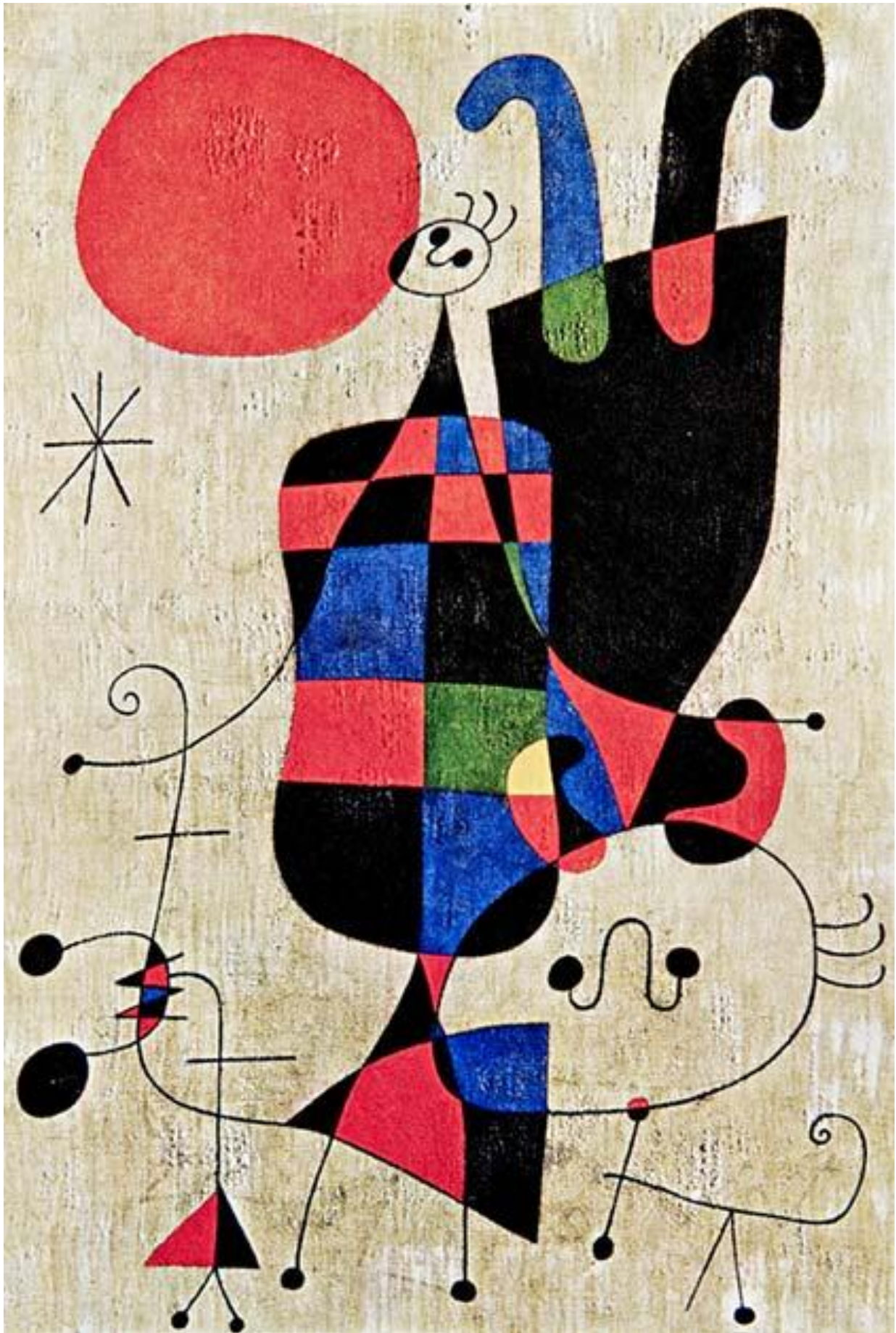
Joan Miró, EL comienzo del día , 1968