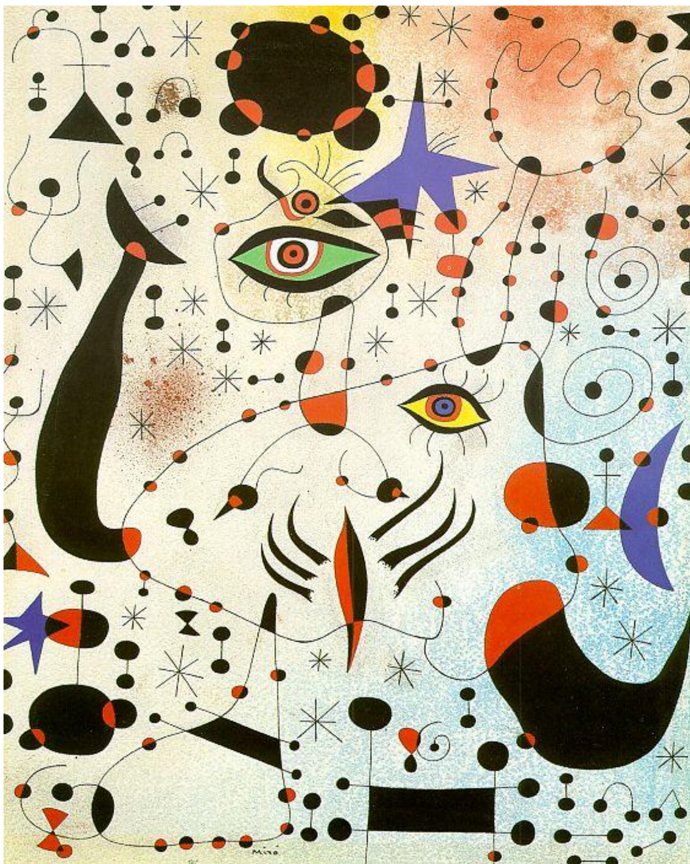
Joan Miró, Constelaciones en el amor de una mujer , 1941