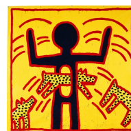
the political line