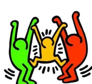
Keith Haring 2