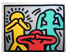
the political line