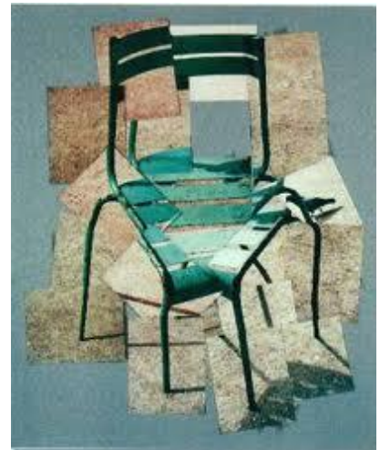
«A Chair, Jardin du Luxembourg»