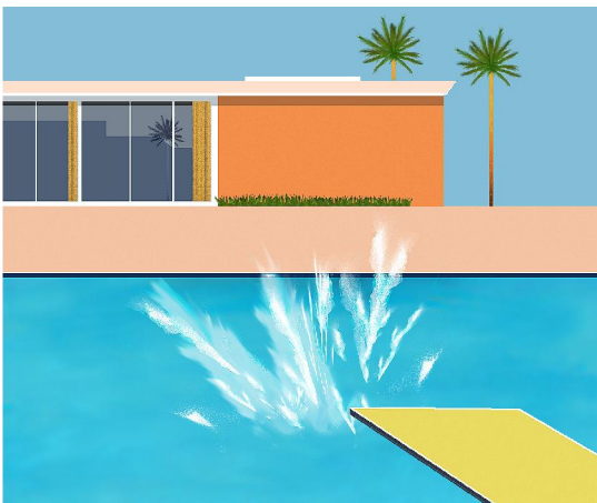
«A Bigger Splash»