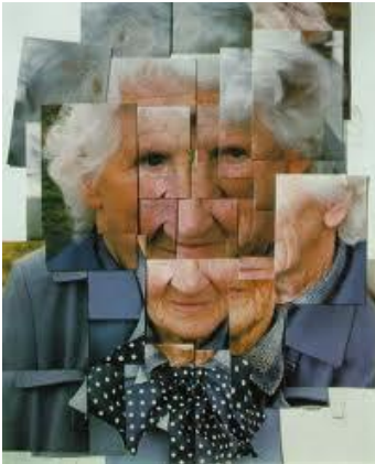
Portrait de sa mère