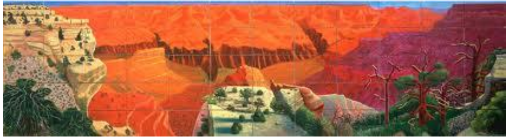
«A closer Grand Canyon»