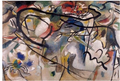
Composition n°5 (1911)