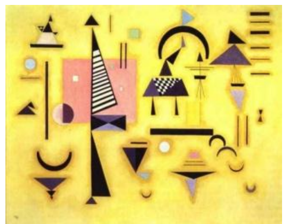
Rose décisif (1932)