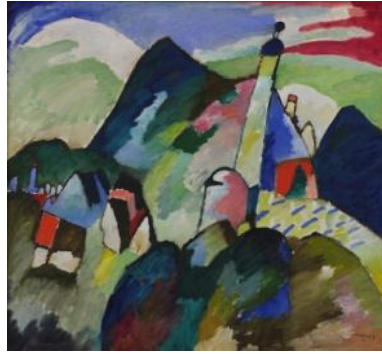
Murnau mit Kirche (1910) Murnau avec église