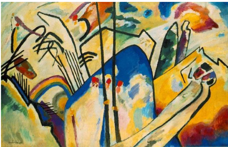
Composition n°4 (1911)