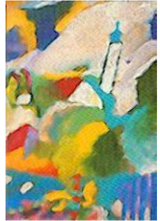
Kirche in Murnau (1910) Eglise à Murnau